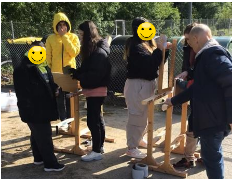
Die H9 hat ein Hochbeet gebaut