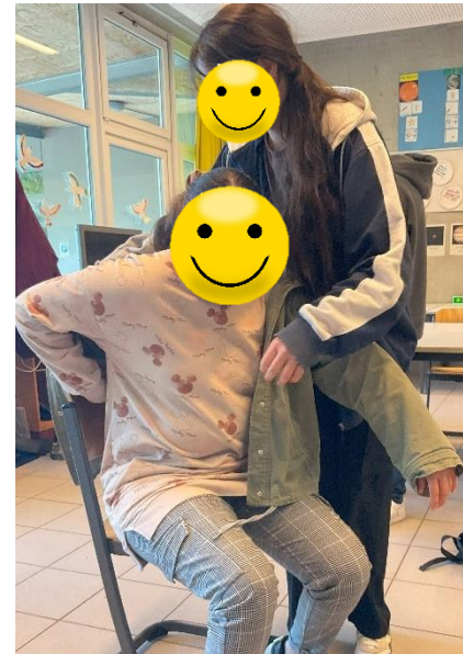
In der H8b wurde das Helfen beim Jacke anziehen geübt.